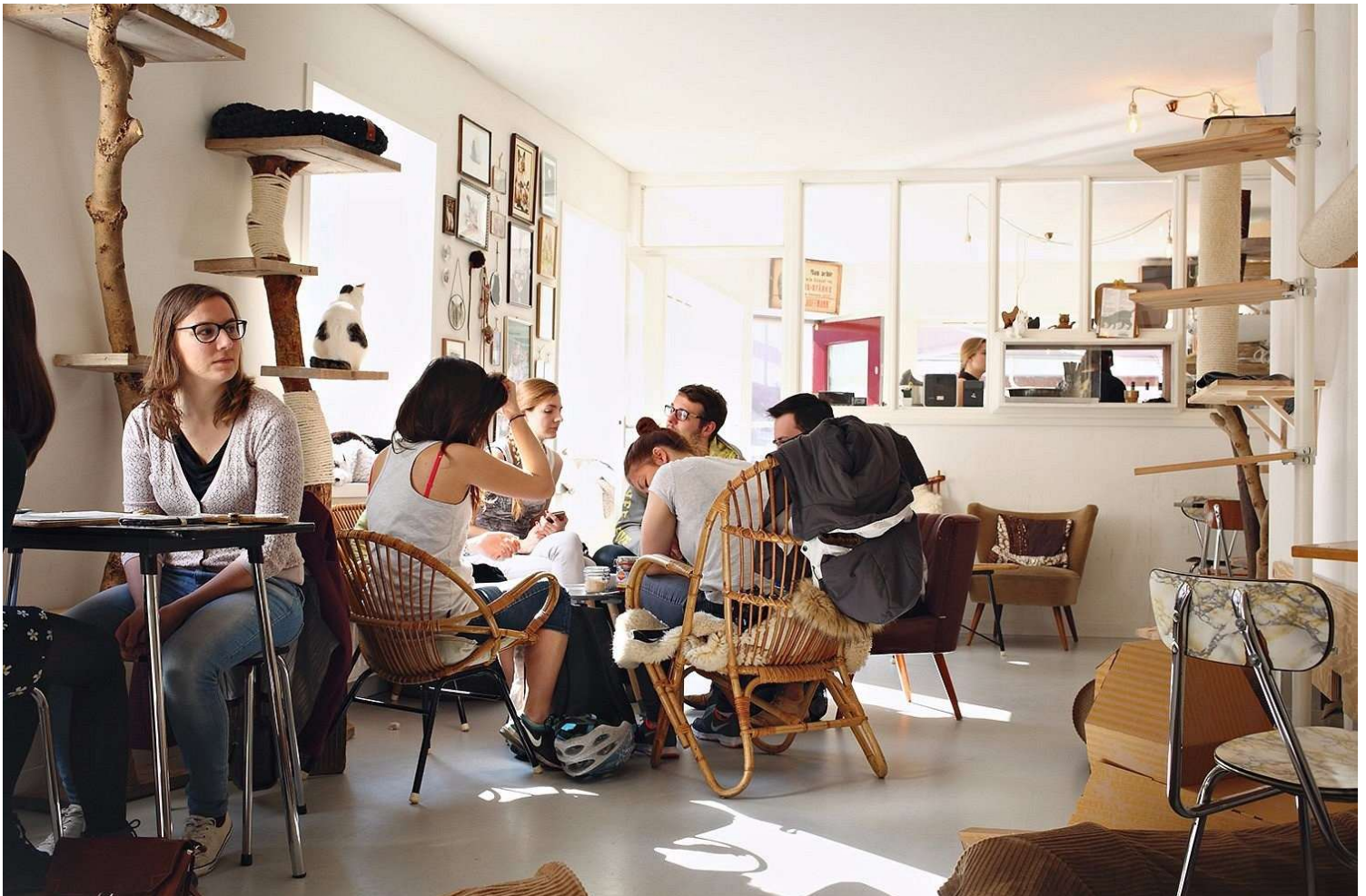
Figuur 2: Eerste kattencafé in Nederland, in Amsterdam

Uit een onderzoek van Levine et al 9 , waarin asielkatten in huishoudens met andere katten werden geïntroduceerd, bleek het onduidelijk of er concrete risicofactoren zijn die agressie kunnen voorspel-