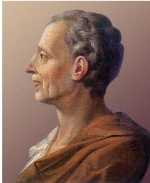
Charles de Secondat, Baron de las Brede et de Montesquieu (1689-1755)